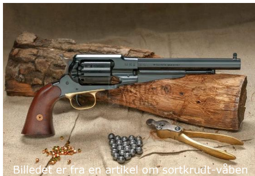
Billedet er fra en artikel om sortkrudt-våben

Jeg var på foreningsbesøg i Hillerød Røgsvag/Sortkrudt, som skyder pistol på Hanebjergs lille pistolbane om tirsdagen. Der mødte jeg en engageret flok skytter, der deler interessen for det at skyde med sortkrudt, altså forlader-våben, løse fænghætter og hjemmestøbte blykugler.