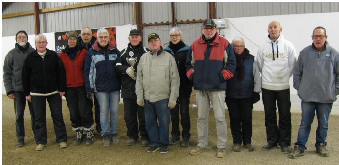
Nr. 3 Hornborg Petanque Nr. 1 Hvirring Petanqueklub Nr. 2 Horsens Petanque