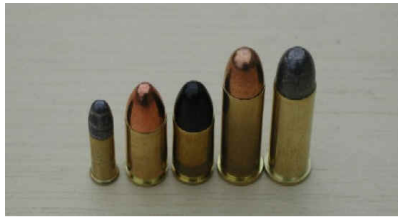
Ammunition, som er OK

.22, .38 og 9mm rundnæset ammunition sælges til stævnet.