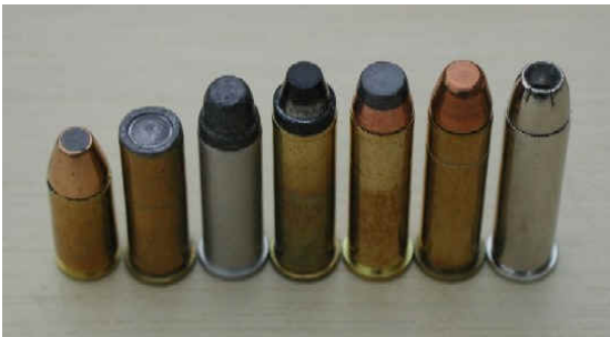
Må ikke bruges!

Der må kun anvendes rundnæset ammunition.